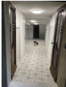
Der Hauseingang. Tiere sind erlaubt.