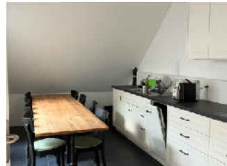
Gemeinschaftsraum mit Zugang zur Dachterrasse