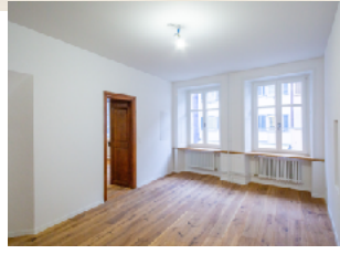
Wohnzimmer mit Blick auf Rathausstrasse