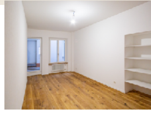
Schlafzimmer zum privaten und ruhigen Innenhof